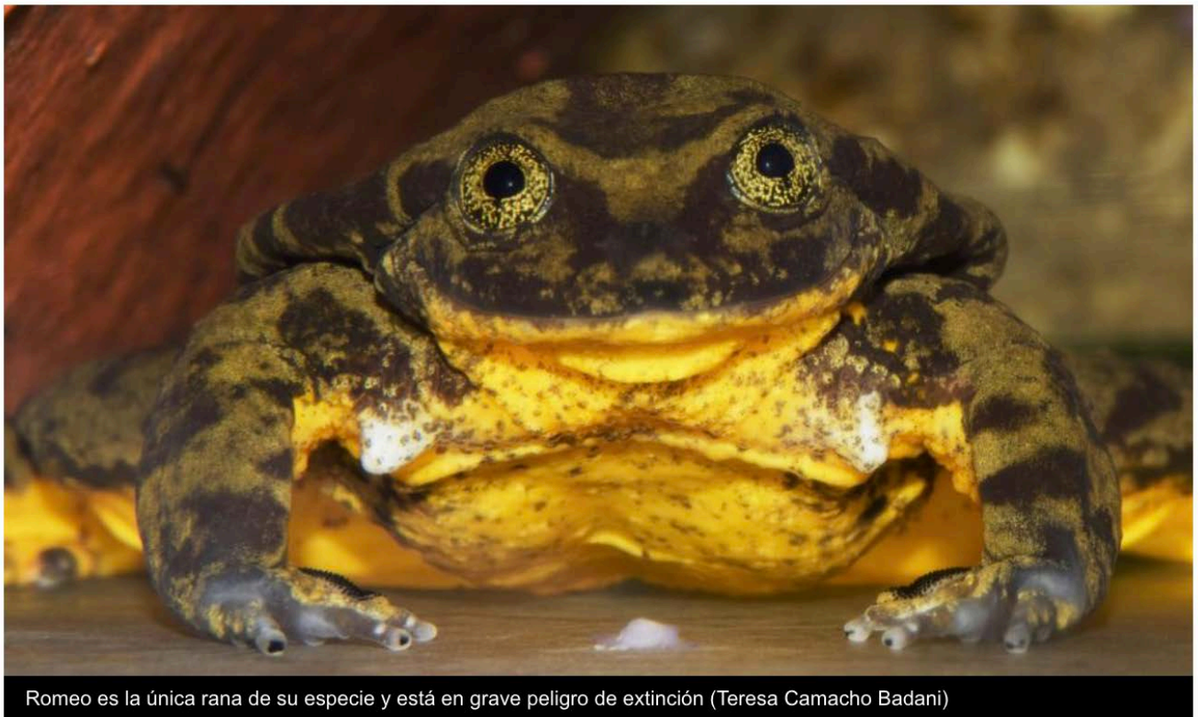
Romeo es la única rana de su especie y está en grave peligro de extinción (Teresa Camacho Badani)

“Hola, soy Romeo, la última rana de mi especie, la Telmatobius yuracare . Por esto estoy aquí, para encontrar a la pareja perfecta, esa que evite mi extinción”. Así se describe Romeo, una rana de una especie boliviana que se encuentra en peligro de extinción, en su perfil de Match, una app para encontrar pareja.