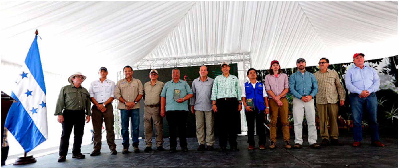
Las autoridades que firmaron el acuerdo para proteger Kaha Kamasa.