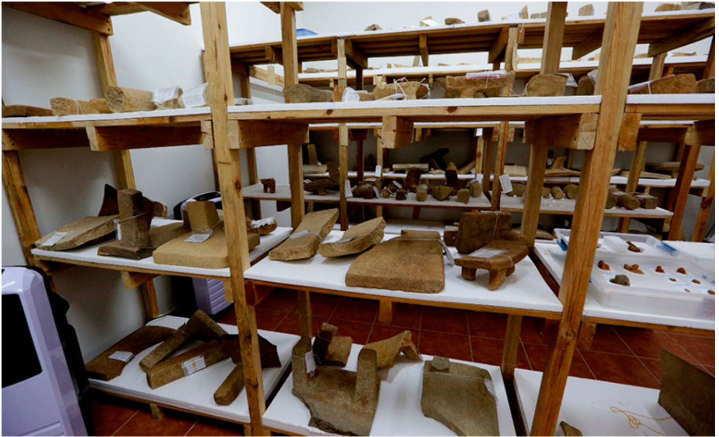
La mayoría son piezas de cocina que utilizaban las mujeres.