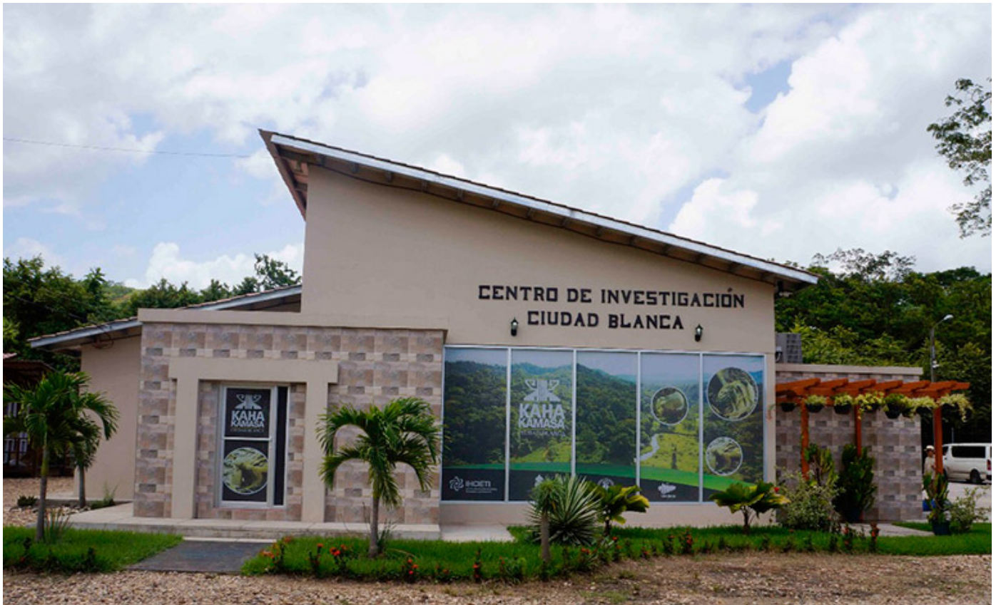
El edificio en donde se pueden observar los restos de la civilización.

La Fundación Kaha Kamasa está integrada en primera instancia por el Instituto Hondureño de Ciencia, Tecnología y la Innovación (IHCITI), el Instituto Hondureño de Antropología e Historia y el Instituto de Conservación Forestal, en conjunto con varias organizaciones y personalidades nacionales y extranjeras.